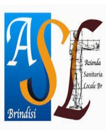
Azienda Sanitaria Locale Brindisi