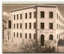
Istituto I. S. "V. Lilla" Francavilla Fontana