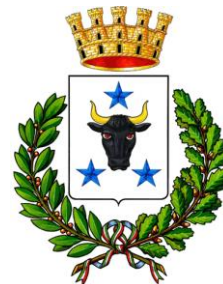
Città di Latiano