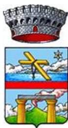
Città di Pompei gemellata con Latiano

in collaborazione e con il patrocinio di