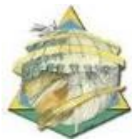
Fondazione Opera Beato Bartolo Longo Ente Morale ONLUS