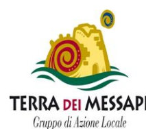
GAL Terra dei Messapi