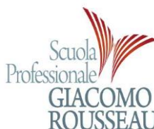
Scuola Professionale Giacomo Rousseau