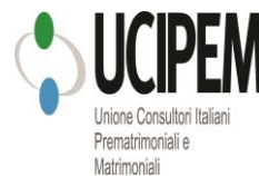
Unione Consulenti Italiani Prematrimoniali e Matrimoniali